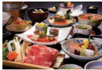
極上豊後牛しゃぶしゃぶ