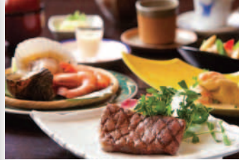
豊後牛ステーキ & 地獄蒸し