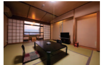
本館和室 (客室一例)