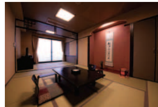
新館和室 (客室一例)