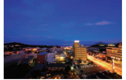
ラウンジからの夜景